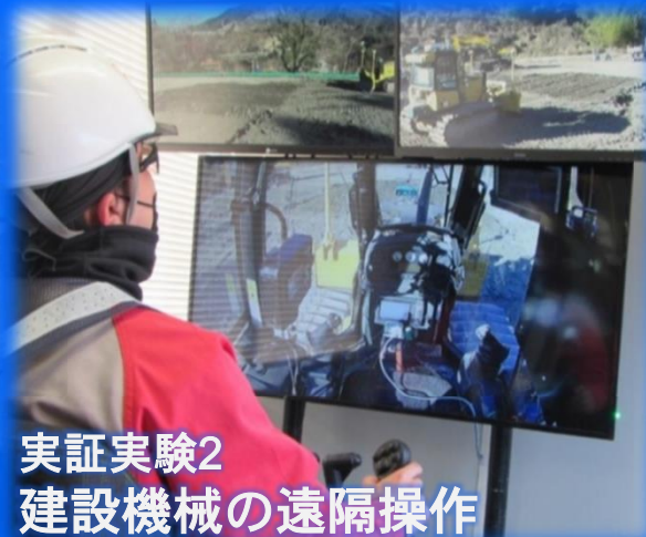
実証実験2 建設機械の遠隔操作