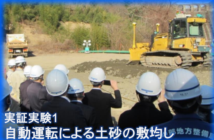
実証実験1 自動運転による土砂の敷均し