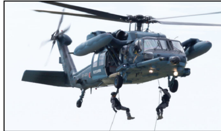
孤立者の捜索・救助・救護訓練