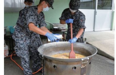
炊事車による炊き出し訓練