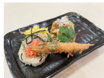
沼津代表 Sea 級グルメ 「深海エビとアジの沼津小判めし」

（Sea 級グルメ全国大会）国土交通省 中部地方整備局 清水港湾事務所 企画調整課 対木（ついき）、今川 TEL：054-352-4148