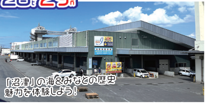
「沼津」の海&みなとの歴史 魅力を体験しよう!