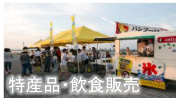
特産品・飲食販売