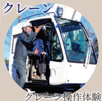
クレーン操作体験