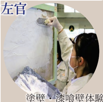
塗壁・漆喰壁体験