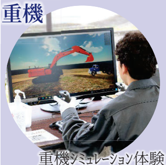
重機シミュレーション体験