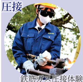
鉄筋ガス圧接体験