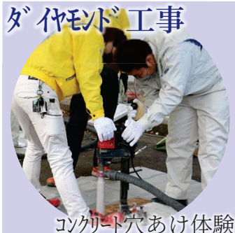
コンクリート穴あけ体験