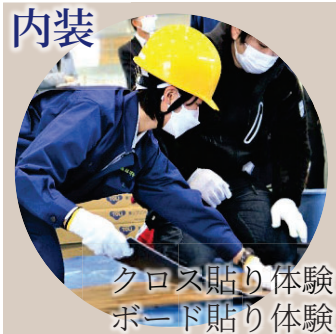
クロス貼り体験 ボード貼り体験