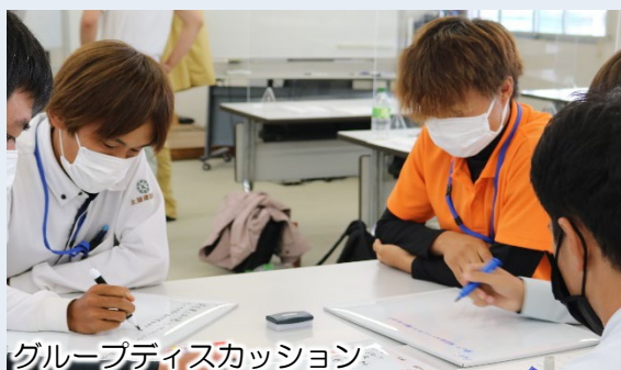
グループディスカッション

主催：中部圏建設担い手育成ネットワーク協議会（※） 後援：国土交通省中部地方整備局