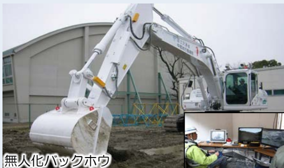
無人化バックホウ