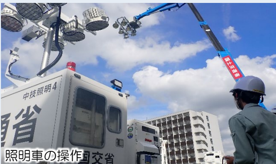
照明車の操作訓練