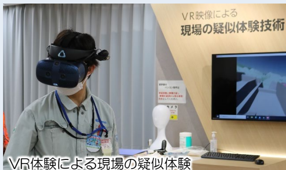
VR体験による現場の疑似体験