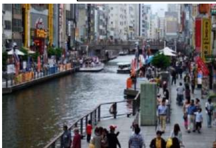
遊歩道の民間活用 (道頓堀川/大阪市)