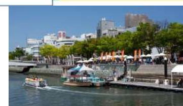
親水護岸の利用 (新町川/徳島市)