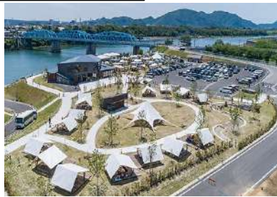
賑わい拠点の整備 (木曾川/美濃加茂市)