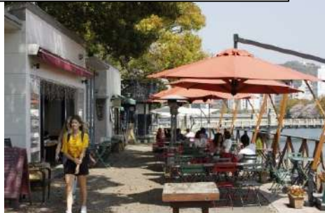
オープンカフェの設置 (京橋川/広島市)