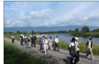
河川管理用通路の利用 (最上川/長井市)