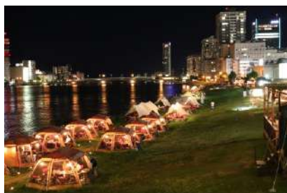
民間事業者の参加 (信濃川/新潟市)