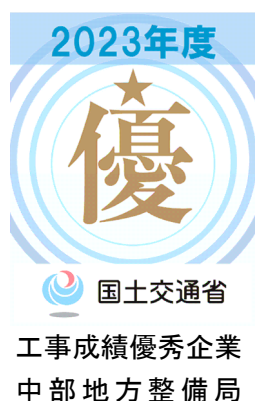
図－1 シール等での使用デザイン

認定企業は、中部地方整備局及び事務所が発注する土木工事（営繕、港湾空港工事は除く）における総合評価落札方式の資格審査の評価項目として加点されます。（詳細は、「工事調達における総合評価落札方式の運用ガイドライン」等による）