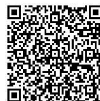
新伊勢神トンネル工事動画 (およそ4分)