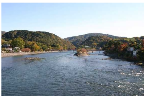
宇治橋から宇治川上流を望む

第1期計画では、お茶と宇治のまち歴史公園(情報発信・観光交流施設及び史跡)の整備を実施し、令和3年8月に開園しました。その他、重要文化的景観保存事業などを実施し、まちづくり活動の活性化や宇治茶ブランドの価値の向上、探究的な学習の充実などの成果が得られました。