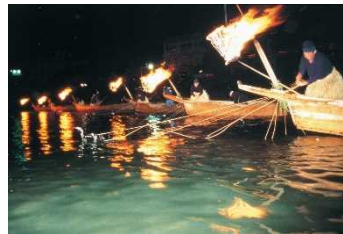
【岐阜市】ぎふ長良川の鶺鴒