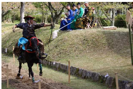
鷲原八幡宮境内で矢を射る流鏝馬神事

第2期計画では、歴史的風致を構成する建造物の保存・活用をはじめ、点在する歴史資産等を町民や来訪者が快適に周遊するための環境整備、地域の祭礼行事・伝統文化等の継承、町民の歴史文化に対する理解増進に資する事業に重点的に取り組み、歴史的風致の維持向上に関する課題の解消を目指してまいります。