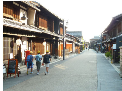
日常の暮らしを残す川原町の古いまちなみ