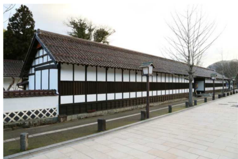
藩校養老館(県史跡)と殿町通り とのまちどお