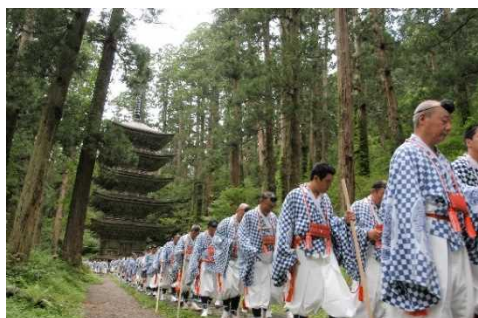
羽黒山五重塔(国宝)と修験道・秋の峰入り