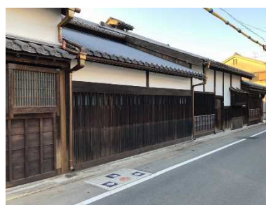
井上関右衛門家住宅(鉄砲鍛冶屋敷) (市指定有形文化財)