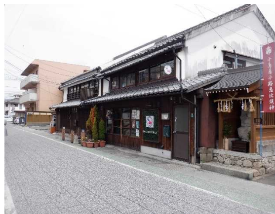
小鳥居小路の恵比寿像と 歴史的風致形成建造物 ことりいしろうじ