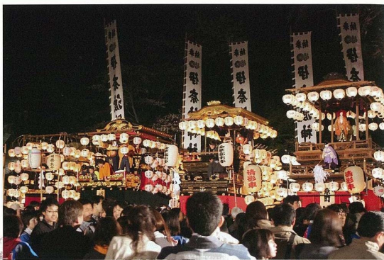
伊奈波神社で行われる岐阜まつり

第2期計画では伝統的な活動の担い手不足などの課題に取り組むほか、第1期計画で進めた整備をより一層推し進め、市民の誇りにつながる本物志向の観光まちづくりに引き続き取り組んでいきます。