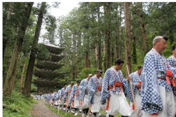
【鶴岡市】羽黒山五重塔（国宝）と 修験道・秋の峰入り

鶴岡市、岐阜市、宇治市、堺市、津和野町、太宰府市の歴史まちづくり計画（第2期）について、歴史まちづくり法に基づき、3月29日付けで主務大臣（文部科学大臣、農林水産大臣、国土交通大臣）が認定しました。（各認定都市の詳細は別紙参照）