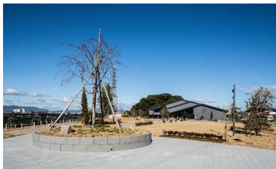
お茶と宇治のまち歴史公園