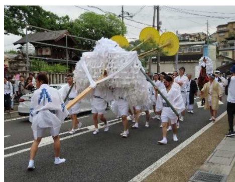
たいへいしんじ 宇治のまちなみと大幣神事