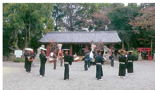
桜井神社拝殿(国宝)と上神谷のこどり