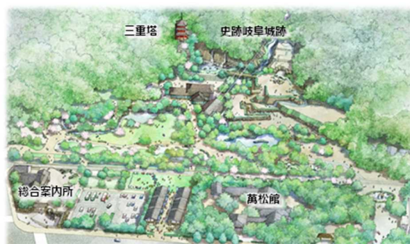
岐阜公園再整備イメージ