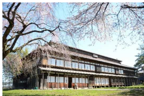
松ヶ岡開墾場(史跡)