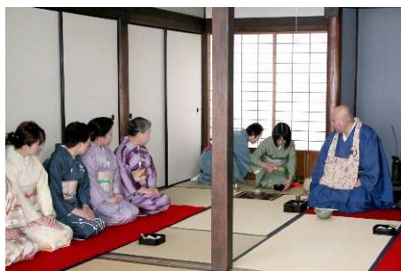
2月に南宗寺などで利休を偲ぶ利休忌

本計画の実施により、市内外の人々が様々な時代を背景とした本市の歴史的風致を知り体感するたびに、新たな歴史への興味が得られるよう、歴史的風致のより一層の向上をめざします。