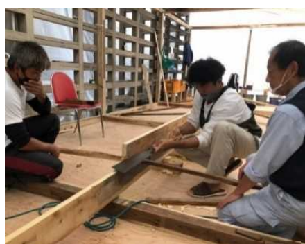
舟大工の育成(鶺鴒舟の造船)

第2期計画では、伝統的な活動の担い手不足などの課題に取り組むほか、第1期計画で進めた整備についても、市民の誇りにつながる本物志向の観光まちづくりに取り組んでいきます。