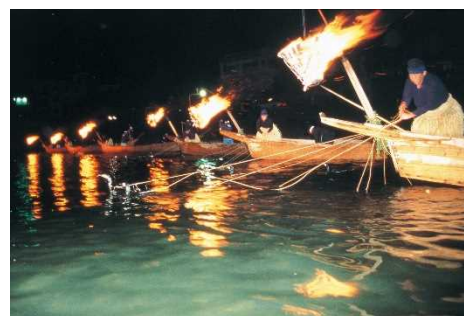
ぎふ長良川の鶺鴒