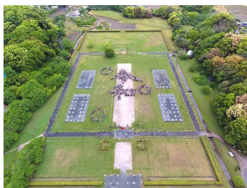
「令和」の人文字プロジェクトが行われた 大宰府跡(特別史跡) だざいふあと