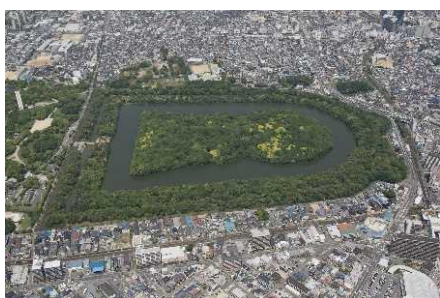
百舌鳥古墳群(仁徳天皇陵古墳および周辺) (世界遺産構成資産・一部史跡)