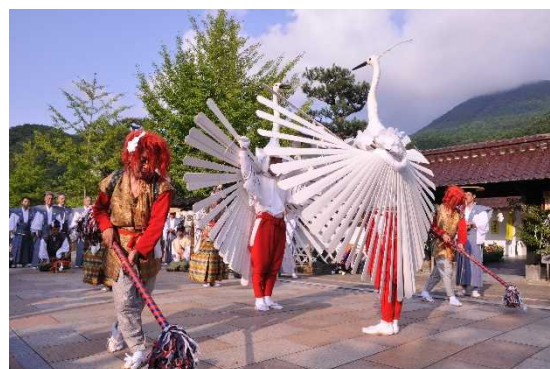
とうやまえ 頭屋前(町民センター)で舞う鷲舞神事