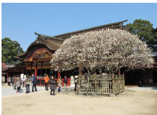
太宰府天満宮本殿(重要文化財)と飛梅 とびうめ