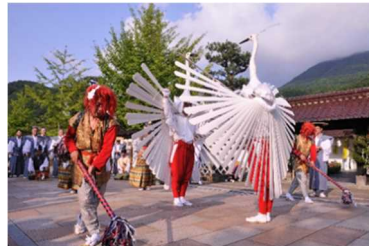
【津和野町】頭屋前（町民センター）で舞う 鶺鴒舞神事