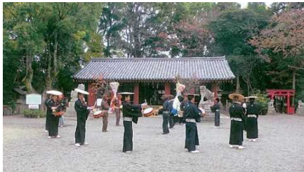
【堺市】桜井神社拝殿（国宝）と 上神谷のごどり