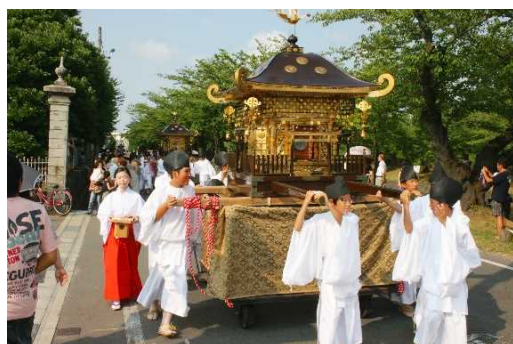
鶴ヶ岡城下町地区 しょうないたいさい 荘内大祭の大名行列

第2期計画では、第1期計画の評価と検証を行うとともに、引き続き、公共施設等の修景整備や支援、協議会の活動助成等による歴史的建造物の保存と活用を図るほか、歴史的・文化的資源を活かした歴史と魅力あるまちづくりの推進、豊かな自然、歴史、文化、景観を背景とした固有の歴史的風致の維持向上を図り、市民の歴史まちづくりへの理解醸成と国内外に向けた魅力発信をまいります。