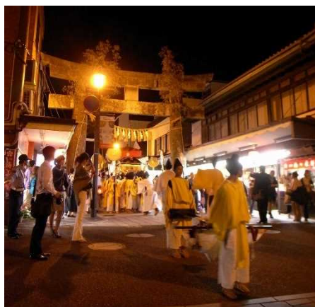
太宰府天満宮参道を通る 神幸式の行列 しんこうしき

第2期計画では、引き続き、歴史的建造物の保存修理やその他の建造物の修景のほか「さいふまいり」の名所地や散策路、文化遺産周辺の環境整備を推進することで、各エリアの個性や魅力を向上させ、歴史的風致の維持及び向上を図っていきます。このことにより太宰府天満宮参道一極集中となっている来訪者の回遊性をさらに高め、滞在時間の延長に繋がります。