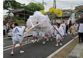
【宇治市】宇治のまちなみと大幣神事