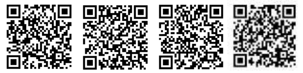
名古屋支社 東京支社 八王子支社 金沢支社