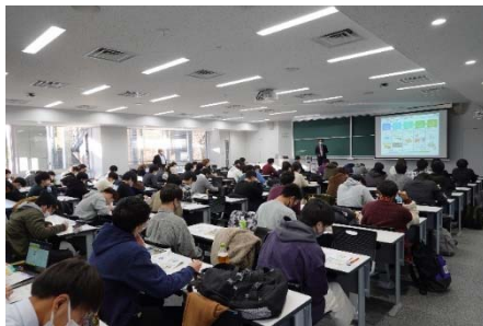
建設 ICT の専門家による講義