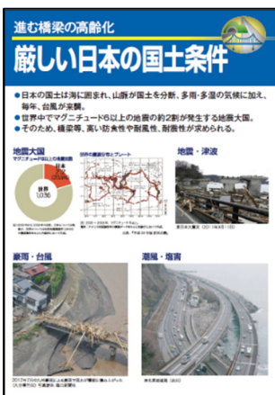
「橋をまもる」パネル