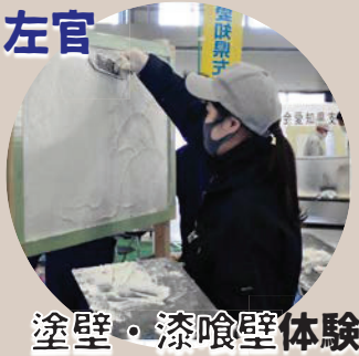
塗壁・漆喰壁体験