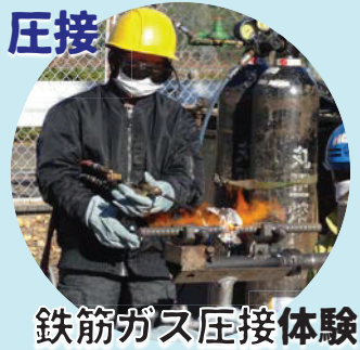
鉄筋ガス圧接体験