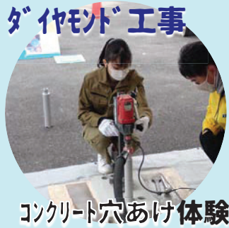
コンクリート穴あけ体験