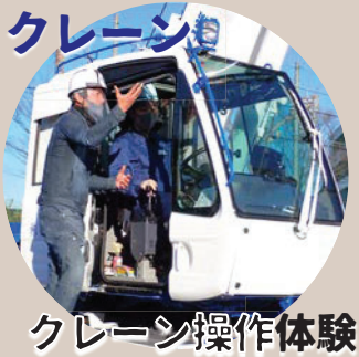
クレーン操作体験