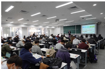
建設 ICT の専門家による講義