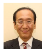
日比 一昭 津島市長