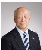
日置 敏明 郡上市長