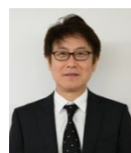
松木 正一郎 下田市長