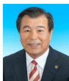
豊岡 武士 三島市長