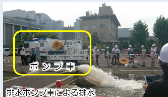
排水ポンプ車による排水