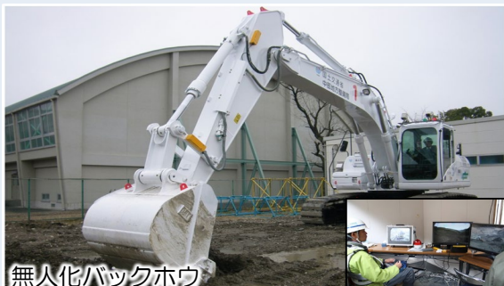
無人化バックホウ