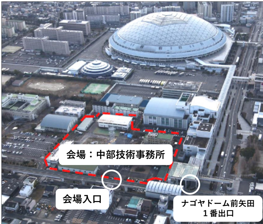
中部技術事務所 入口