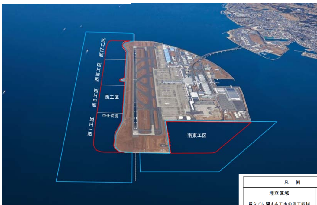
名古屋港新土砂処分場 計画平面図