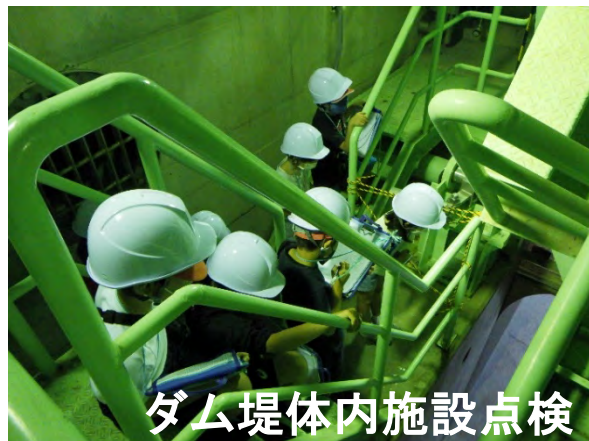
ダム堤体内施設点検