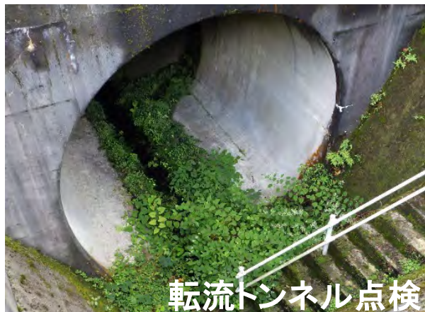
転流トンネル点検