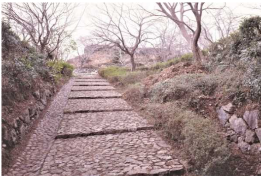
とばやまじょうあと 鳥羽山城跡