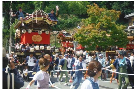
ふたまた 二俣まつり