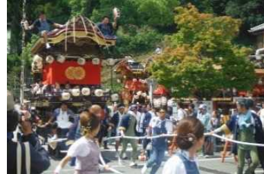
ふたまた 二俣まつり