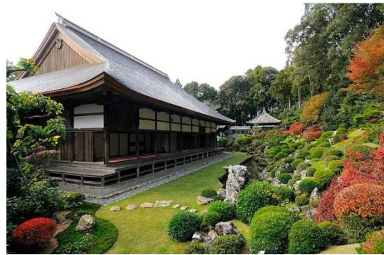
りょうたん じていえん 龍潭寺庭園