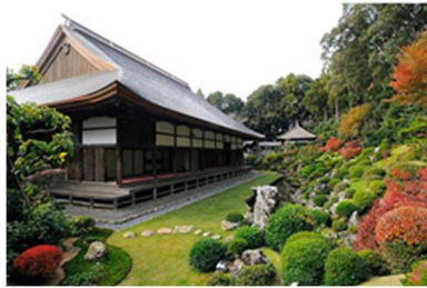
りょうたんじていえん 龍潭寺庭園

歴史まちづくり法第5条に基づき、3月25日付けで主務大臣（文部科学大臣、農林水産大臣、国土交通大臣）の認定を受けた静岡県浜松市の歴史的風致維持向上計画について、下記のとおり認定式を開催しますので、お知らせします。