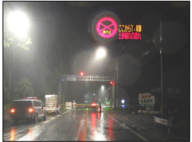
小田木遮断機を使用した夜間通行止の様子(H30.9.5)