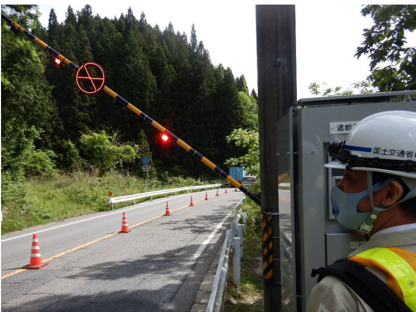
実際に操作し、遮断機をおろす