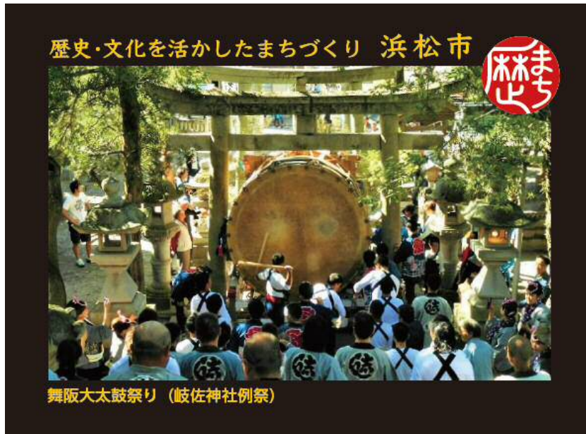
舞阪大太鼓祭り（岐佐神社例祭）