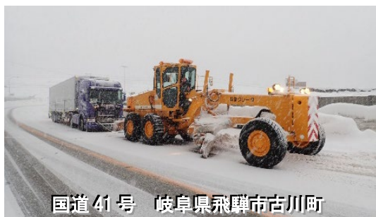
スタック車両の発生状況 (R4. 1. 13)