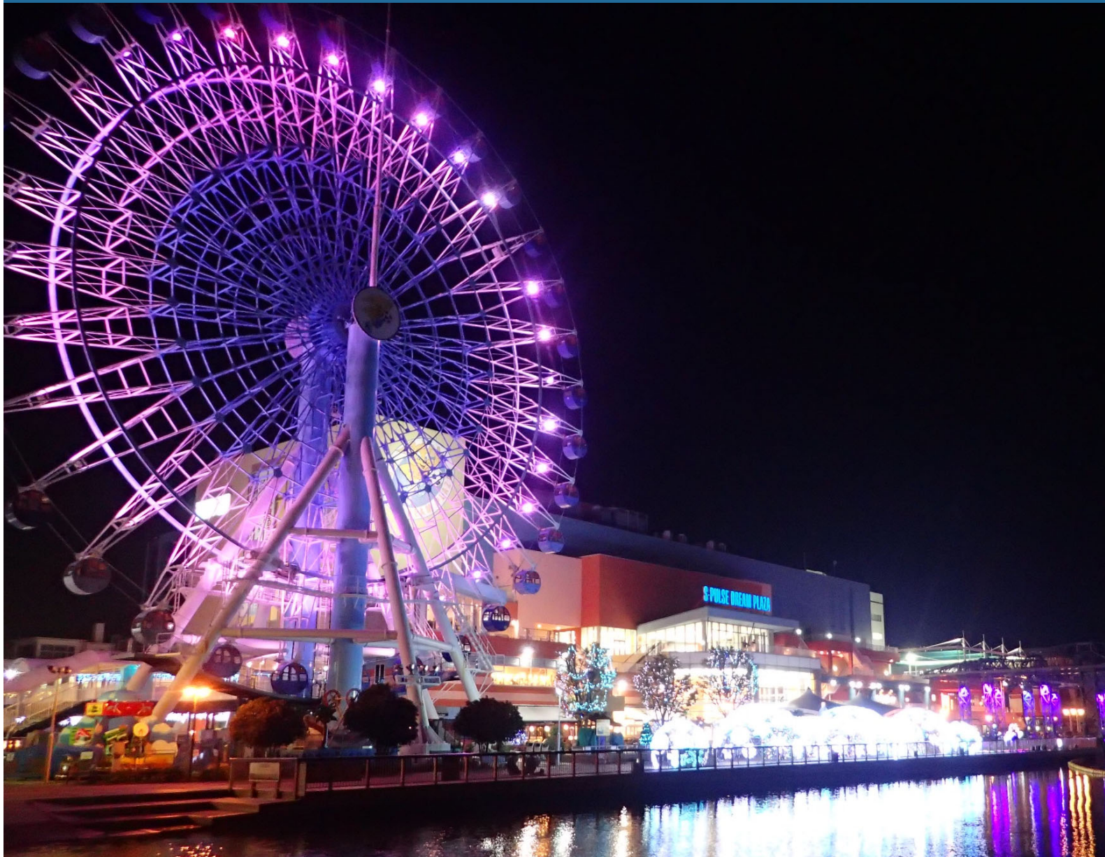
清水港エスパルスドリームプラザ (2021年11月撮影)