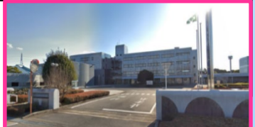
ポリテクセンター中部 外観