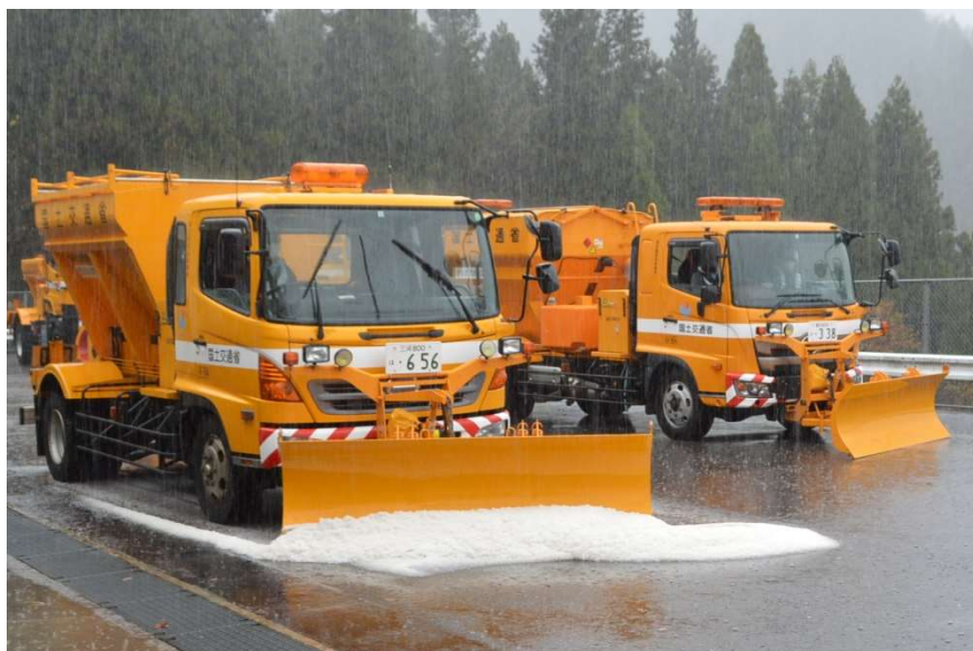
除雪作業のデモンストレーション