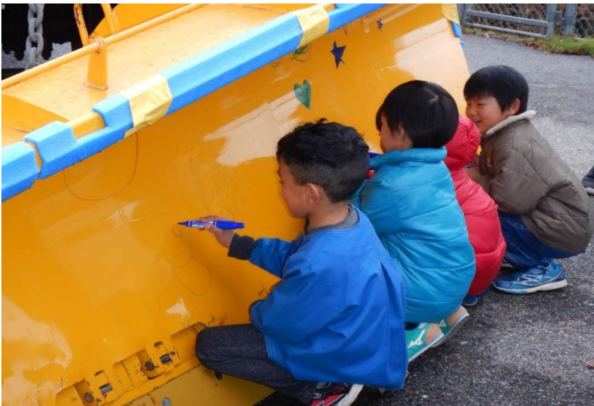
雪かき部への絵描き