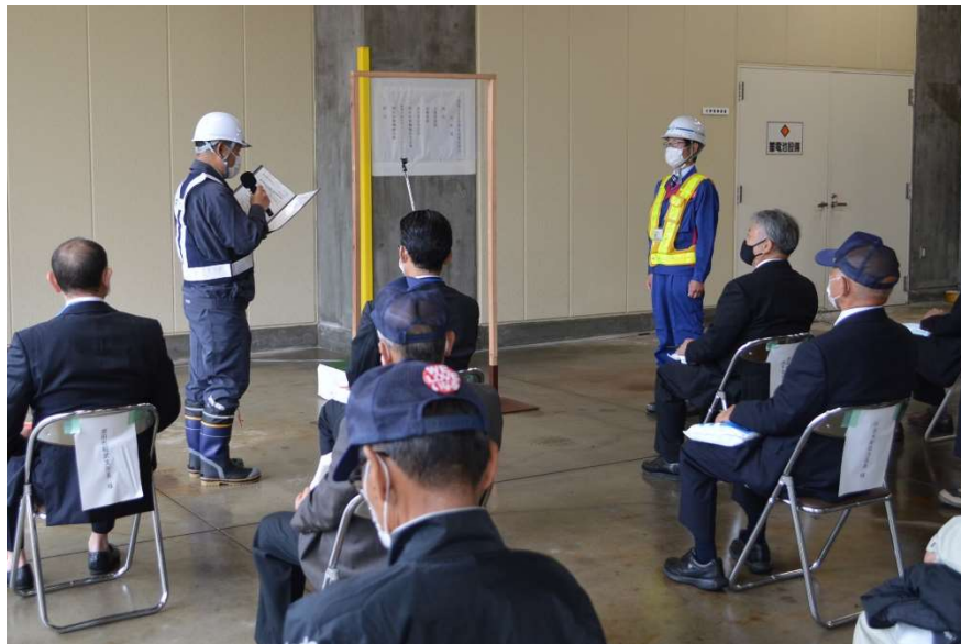
受注者による安全宣言