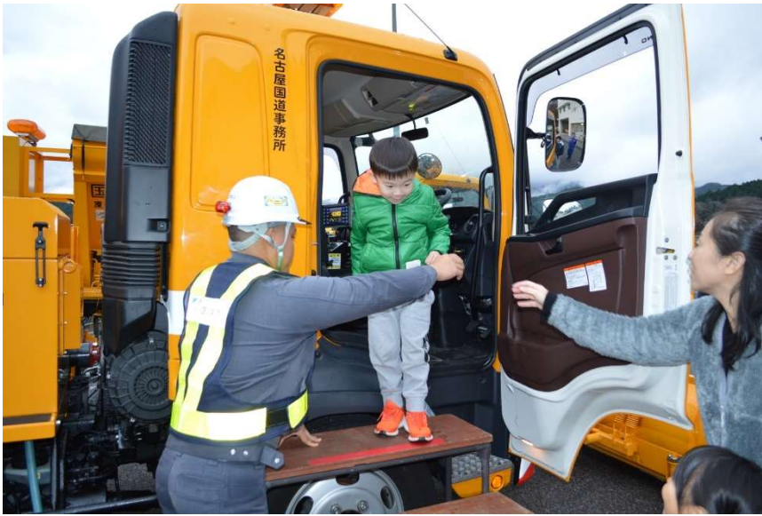
薬剤散布車の搭乗体験