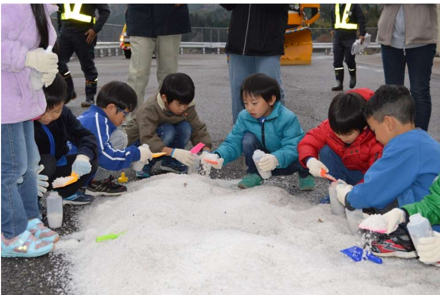
凍結防止剤のボトル詰め