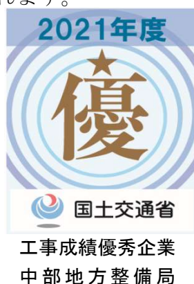
図－1 工事成績優秀企業認定シール

認定企業は、中部地方整備局及び事務所が発注する土木工事（営繕、港湾空港工事は除く）における総合評価落札方式の資格審査の評価項目として加点されます。