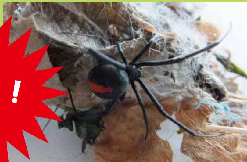
巣の張り方は不規則で立体的です。