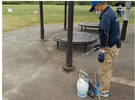
⑥周辺施設消毒 休憩テント支柱