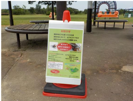
⑤注意喚起看板(近景)