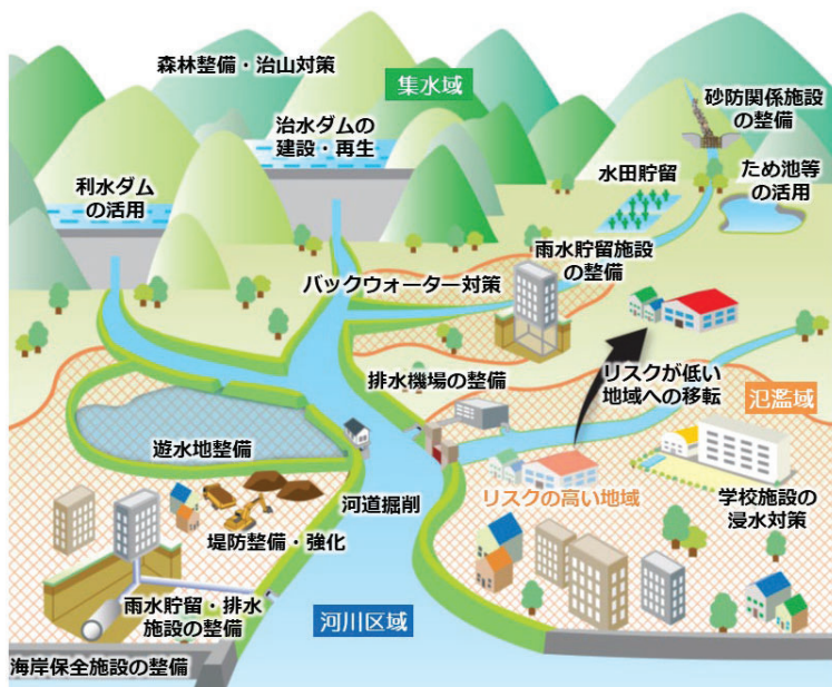
流域治水のイメージ図