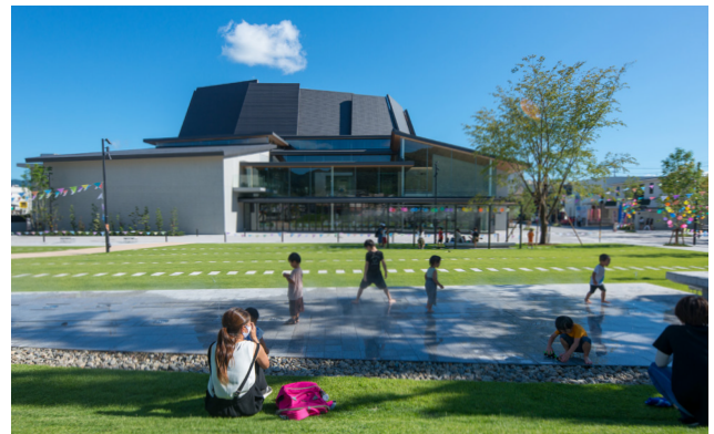
ホールの北側には広場(さくらごろごろパーク)が整備され、子ども達の日常的な遊び場となっている。