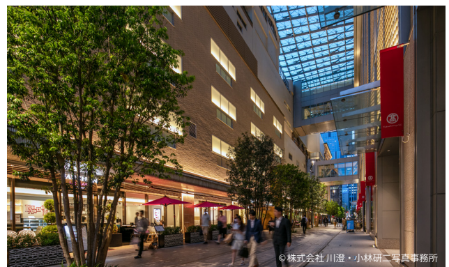
日本橋ガレリアを東から見る。 車両出入口や通用口のあった裏通りが、賑わいの核へと変貌した。