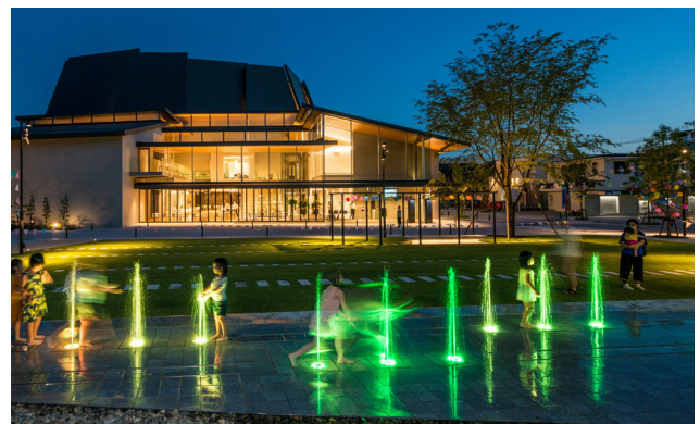
夜間は透過性の高いホールからの明かりや内部で活動する人々の様子が地区内の景観演出に寄与している。