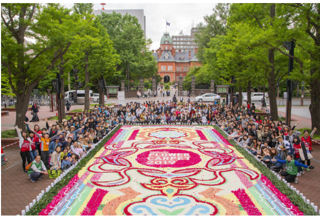
フラワーカーペット完成後に撮影した、制作ボランティアの集合写真

広場オープン時にイベントとして開催されたフラワーカーペットが好評を得たため、翌年実行委員会を設け、地元企業の協力や寄付を得ながらすでに5年実施してきている。実施にあたっては、当日のボランティアはもちろん、制作リーダーの育成、地元の大学へのデザイン依頼など、地域への働きかけも積極的に進めている。また、開催場所も民間の公開空地や屋上広場等すでに4箇所に広がりつつある。魅力的な都市広場において市民参加型で活用する事業を企画運営し、札幌を代表するイベントとして展開させてきたことは、高く評価することができる。今後もアイデアあふれる広場の利活用を期待したい。（卯月）