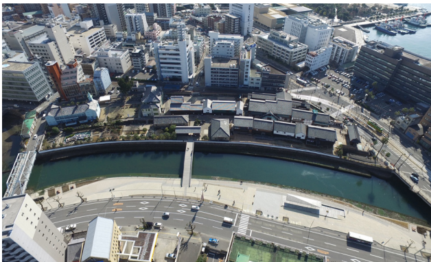
2018年に撮影した出島地区の全景。16棟の建造物、石垣、練堀の復元、史跡地内の電線電柱の地中化、出島表門橋の架橋、出島表門橋公園の整備等を約70年かけて実現した。

復元整備事業が進み、2006年にゾーン化・有料化されて以降、NPO法人による建造物活用や歴史ガイド、地区住民による長崎くんち、市民団体によるイベント、日蘭交流の拠点等として活用され、2018年には年間50万人の来場者を迎え、周辺地区のみならず市全体の観光交流、にぎわいの拠点となるとともに、市を代表し、市民が誇る景観になっている。