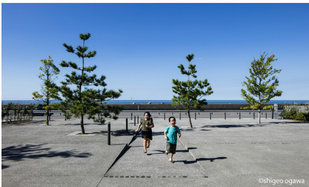
日本海に最も近い大町潮風市民公園