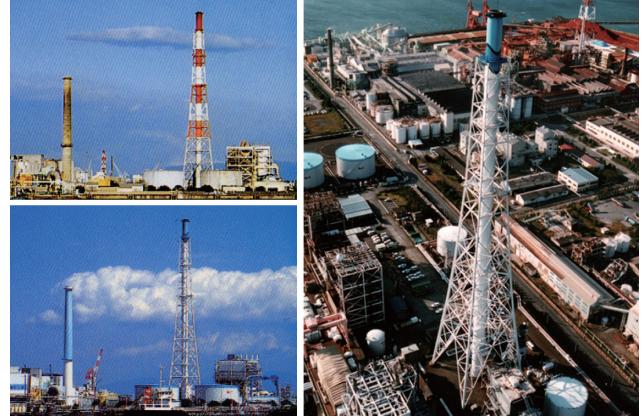
赤白からシンボルカラーへ塗り替えられた煙突。地元住民・事業者・行政が一体となって実現した、計画を象徴する取組。