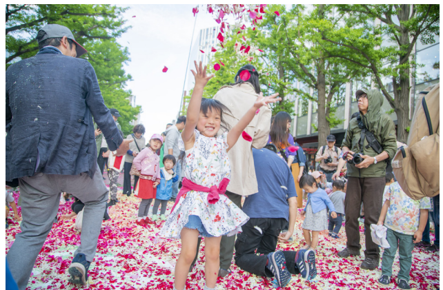
フラワーカーペット内に入って直に花びらに触れることができるフリーウォーキングの様子