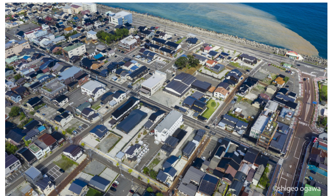
上が日本海側（北）で、下が糸魚川駅側（南）。中央の東西に横断している通りが「本町通り」。駅から日本海に連なる市民公園が整備されている。