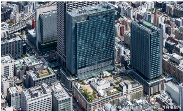
南西側鳥瞰。 手前のB街区、右のA街区、左奥のC街区、その奥に隠れたD街区の一体的開発。

都心部における重要文化財を活用した都市再生プロジェクトとして良質な都市景観を形成しており、十分に「優秀賞」受賞に値するプロジェクトであると判断される。（岸井）