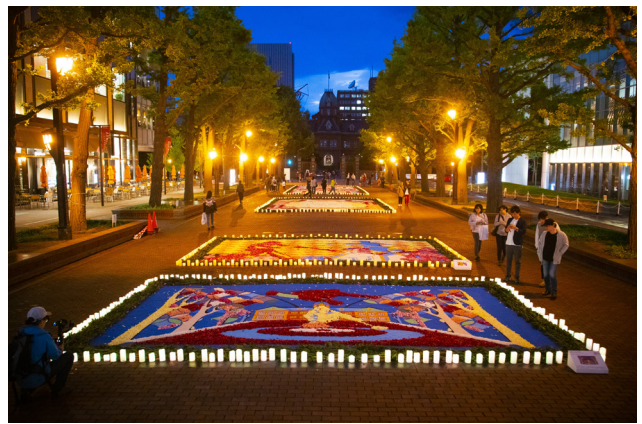
フラワーカーペットのまわりにキャンドルライトを灯して演出している様子