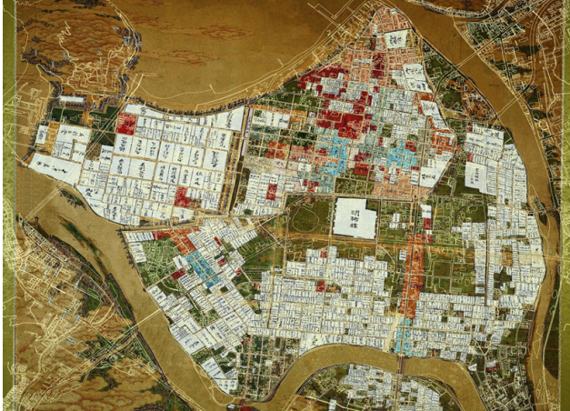
古地図と現代の地図を重ね合わせたもの

萩市は、地形的な特色から江戸時代の地図がそのまま使え、古代から藩政期・明治維新さらに現代へと連続とつながる「時」が日常やまちの表情を彩っている、『まちじゅう屋根のない博物館』である。その彩りは「まち歩きボランティア」による「対話型」案内で理解が深まる。昭和時代に地域の資産価値に気づき、歴史的景観保存条例を制定して景観の保存への努力を積み重ねてきた上に、「萩まちじゅう博物館条例の制定」による地域のプライドを醸成してきたことは高く評価できる。条例に曰く、萩にしかない宝物を次世代に確実に伝え、「萩を終の住処にして良かった」と日々実感できるような魅力あるまちづくりに努め、萩を訪れた人々に萩の良さや歴史を、愛着と誇りを持って伝えることで、「日本の心のふるさと」と思われる、おもてなしをまちじゅうで推進することを決意し、暮らしを美しく育てている「風」が風土・風景・風格・風情を生み出し、おもてなしのスピリッツがにじみ出ている点も高く評価された。次世代への「知の継承」がいつそう推進されることを期待したい。(小澤)