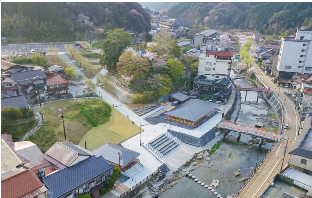
当地区は、音信川沿いに広がる県内最古の歴史をもつ温泉街である。

対象地区は山口県の日本海に近い山あいの小さな温泉街である。地域再興のため、外部の著名人等呼び込み再整備を進めるといった方法は良くみられるものの、そういった方法で成果を挙げられる場所はある程度限られるように思うのだが、当地区は少し状況が異なる。一つは全国温泉地のトップ10入りを目指す、というややとてつもない目標が掲げられていることである。それが外部の有能な人々を惹きつけ、地域の力にしたのではないかと思える。また全国で活躍しているこの外部の人たちの多くが、自ら資産を持つという形でこの取り組みに参加している状況にも着目される。計画や作られた景観について評価すべきは、思い切った計画を躊躇なく実行したこと、といえるだろう。当初描かれた全体構想は、対象とされた土地の範囲を超え、温泉街の他の人の土地にも遠慮なく描かれ、そして実行された。そしてかなり手の込んだ照明計画もまた、実行された。総じてデザインは高いレベルを保っているものの、一部にはやや疑問を持つ解答も含まれる。しかしながらそれを超える充実されたソフト面での取り組みと成果も含め、優秀な取り組み例として評価した。（高見）