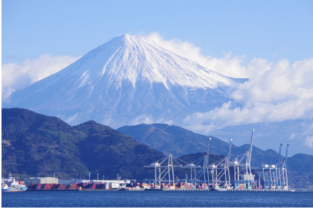
シンボルカラーによりデザインされたガントリークレーンが、富士山と調和した景観を形成している。

港湾を管理する県、まち全体に責任を持つ市、物流・工業・商業などを営む事業者、将来を担う若者たちを含む市民、全体を見渡す専門家。港にかかわる全ての主体がそれぞれに磨き上げた清水港は現代日本を代表する美しいみなとまちである。（福井）