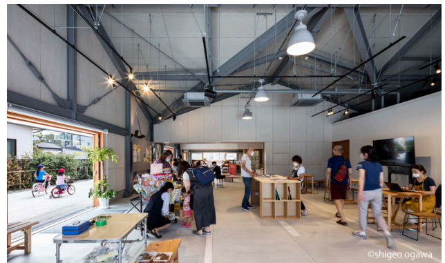
地域の核の1つとなる駅北広場キターレ