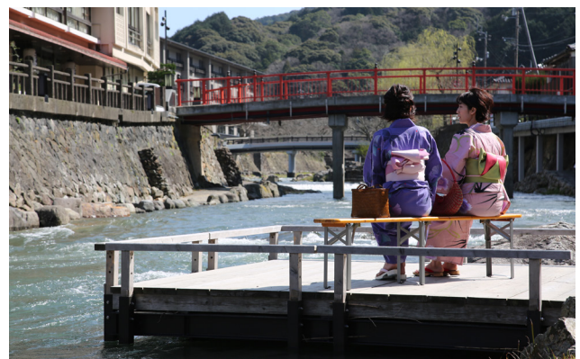
川のせせらぎを聞きながら開放的な空間でくつろぐことのできる川床。