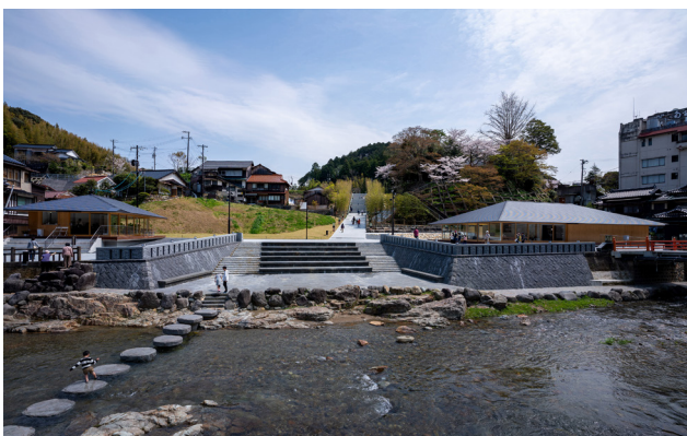
雁木広場は、自由度が高く、回遊性と川辺の景観を楽しむ空間を演出。再建された恩湯（右）と長門市の食材が味わえる恩湯食（左）