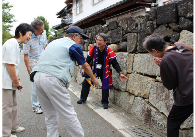
堀内伝建地区のガイドツアーの様子