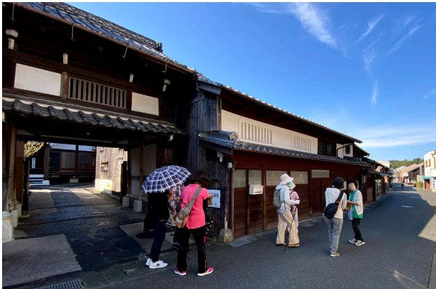
浜崎伝建地区でのガイドツアーの様子