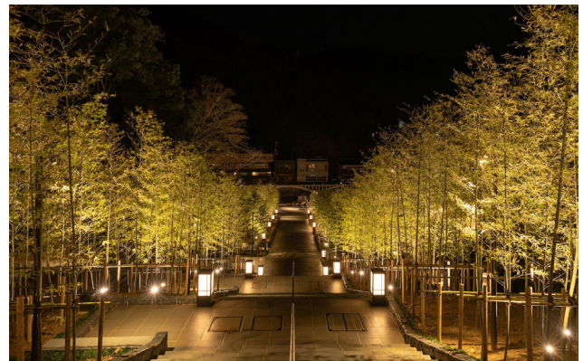
駐車場から雁木広場までを結ぶ竹林の階段。夜間は幻想的な空間となる。