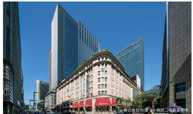
中央通り南西側からの景観。 重要文化財から連なる街並みと、現代的な高層部の対比。