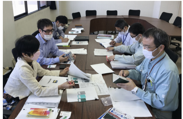
毎月実施する色彩相談会において、事業者と協議しながら取組を進めている。