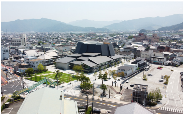
城山からの眺め。ホールの整備にあわせて既存商店街の西側(写真右)にバス停留所を移設。

地名の由来は中世にまで遡り、後に毛利氏によって築城され今もなお城下町の名残が散見される風向の良い港町である。城石垣が残る城山は街の象徴でありホールの名称にも採用されている。対象地区は近代以降商業の中心地として栄え、九州最大手の大型商業施設発祥の地として賑わいの中心であった。しかし、郊外型店舗の急速な進出によって大型商業施設が撤退し中心地の空洞化が加速した。最初の再開発計画は市民の反対運動によって白紙撤回に追い込まれた。その後市民会議の発足、専門家の参画によって合意形成がなされ、市民や高校生達の意見を取り入れた提案書が作られ、市民本位の施設実現に向けて大きく舵が切られた。中核を成す複合施設の謳い文句は「人がいる風景」である。透明性を保ち、周囲からアクティビティが見えることで内外のつながりが生まれた。食文化を広めるためのキッチンコートも市民の要望で誕生した。街並みへの連携はホール屋根の分節化や広々とした芝生広場により実現している。交通広場の移動と再編、芝生マウンドによる国道への遮蔽効果も人の場所づくりに貢献しているようだ。今後、周辺の歴史的街並みと連携した新たな回遊性が生まれることに大いに期待したい。(富田)