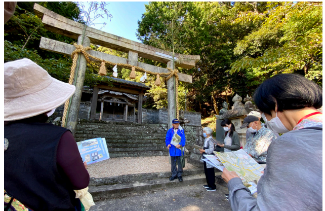
須佐武家町でのガイドツアーの様子