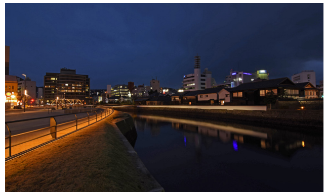
出島、出島表門橋、出島表門橋公園をそれぞれ管轄する3つの部局を超えて一体的にデザインした夜景。