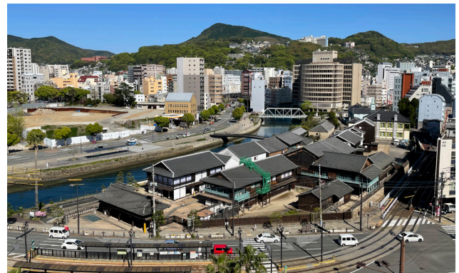
市民によって活用され、長崎市の観光交流、にぎわいの拠点となるとともに、市を代表し、市民が誇る景観となっている。

歴史都市長崎の中心部に、過去と現代が対話する素晴らしい都市景観を創出したこの事業は、まさに大賞の名に相応しいものである。(陣内)