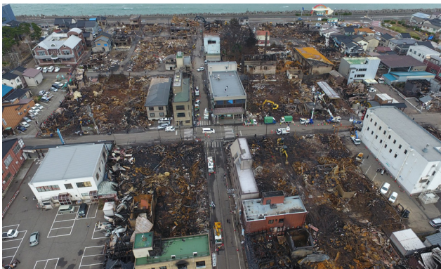
手前が南側、奥手の日本海が北側。平成28年12月22日の糸魚川市駅北大火直後の平成28年12月25日撮影。糸魚川駅北大火では約4ヘクタールを焼失。

地方都市の人口減少と空洞化は残念ながら現実である。そこが災害に見舞われた場合の復興は、この現実が加速することを踏まえて臨まねばならない。糸魚川市駅北地区はまずこの文脈において注目できる。歴史的蓄積のある街中が焼失した後のまちづくりは、意思決定の迅速化を最優先するため小規模単位で進め、空地の創出を恐れずむしろ積極的に市が確保した。そうしてできたランダムな公共空間をどう使うかの視点から、連鎖的なまちの営みをエンカレッジする仕組みと空間整備を並走させる。まずマスタープランと空間整備、次に活用というプロセスとは大きく異なり、現実を見据えたチャレンジである。その成果は核となるキターレから離散的にまちの随所に景観として実を結び始めている。見るべきははまだ整備中の街路景よりも、ここでこうしたいというやる気が見せる場の景である。災害復興に限らず、現代日本の都市景観形成のあり方に一石を投じた事例として特別に高く評価したい。（佐々木）