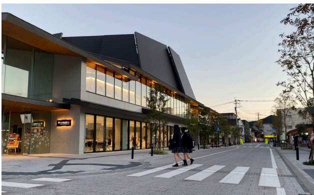
市道側はホールの軒が低く抑えられ、落ち着いた質感の舗装で船頭町まで続いている。