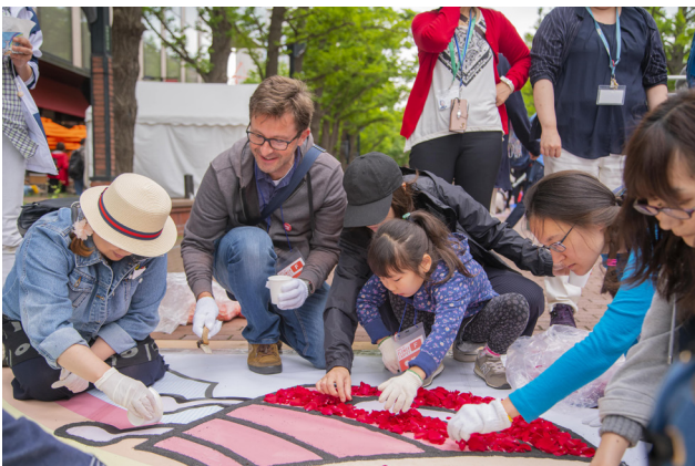
下絵に沿って花びらをならべる作業の様子