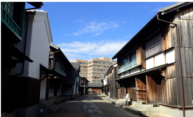
2020年に撮影した出島内の様子。写真正面に写る水門まで復元建物による歴史的まち並みが続いている。