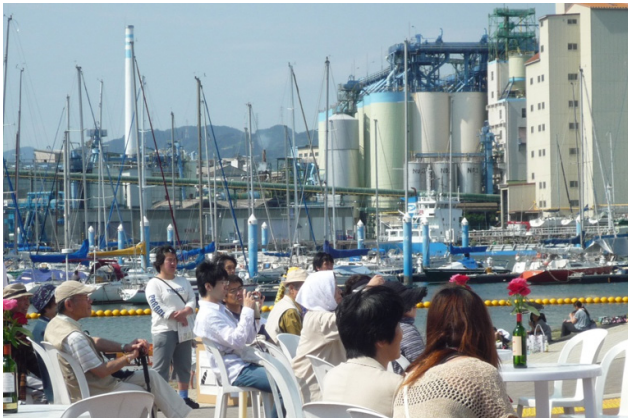
サイロ等の産業景観を背景にイベントを楽しむ様子。市民にとって近寄りたがい港から、賑わい・憩いの場へと変わっていった。