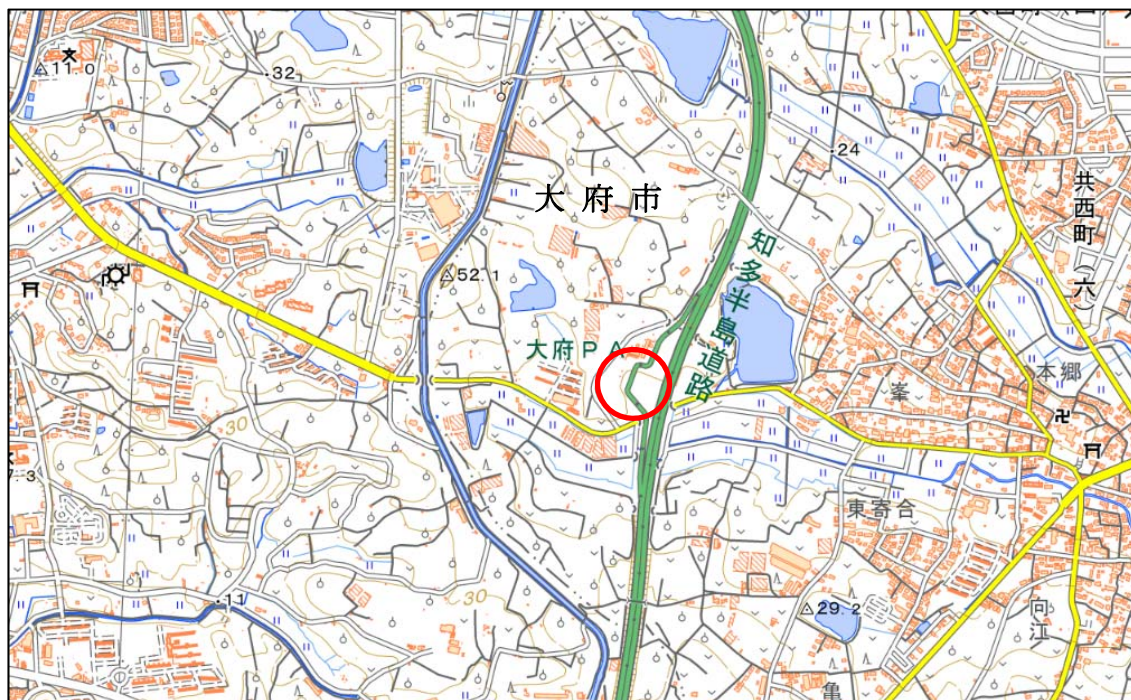
図ー1 大府パーキングエリア 位置図

場 所：大府パーキングエリア 知多半島道路上り線（愛知県大府市長草町石原 57）