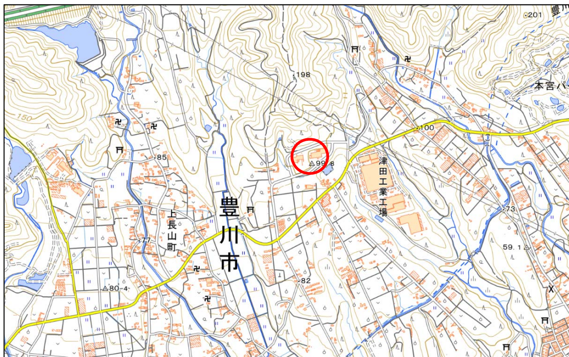
図－3 本宮の湯 位置図

場 所：本宮の湯キッズコーナー休憩スペース（愛知県豊川市上長山町本宮下1番地1685）