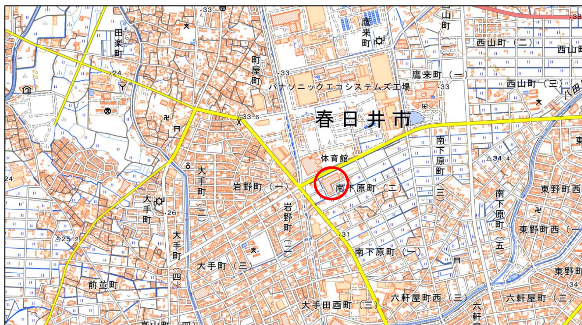
図－4 サンフロッグ春日井 位置図

場 所：サンフロッグ春日井1 F又は2 Fトレーニング室前ロビー （愛知県春日井市南下原町2丁目4番地11）