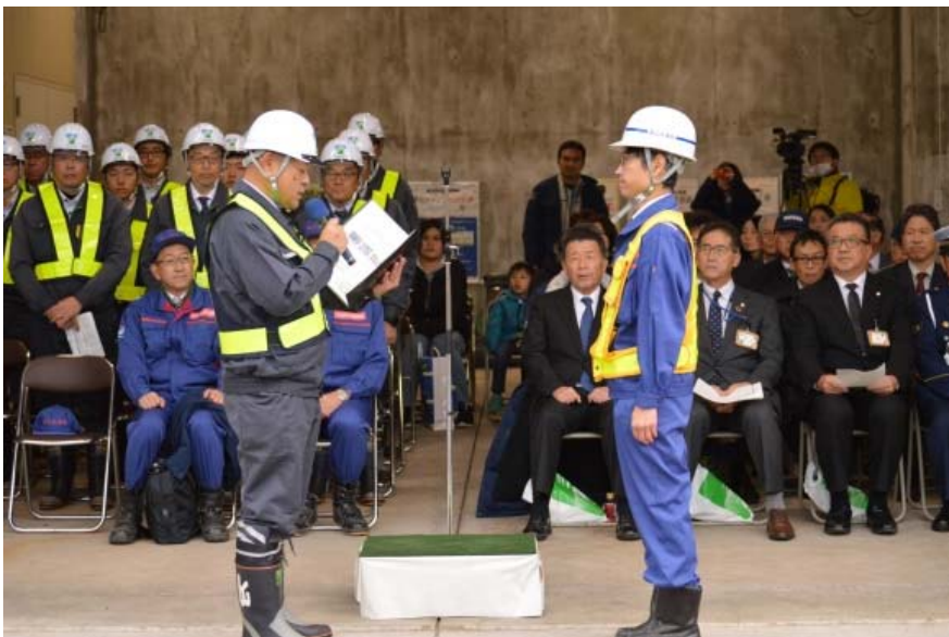
受注者による安全宣言