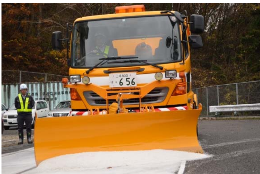
除雪作業のデモンストレーション