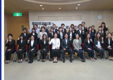
愛知県副知事との意見交流会