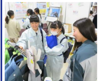
建設技術フェア2019in中部 学生交流ひろば ブース出展