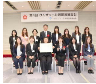
第4回 けんせつ小町活躍推進表彰式