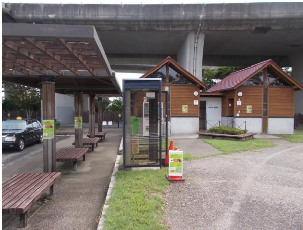
③ 注意喚起看板(遠景)