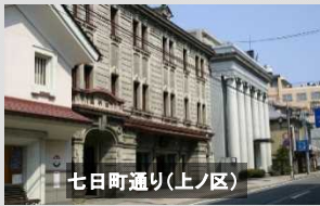
七日町通り(上ノ区)