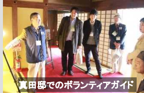
真田邸でのボランティアガイド