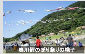
奥川鯉のぼり祭りの様子