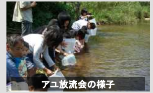
アユ放流会の様子