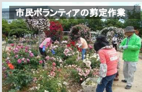
市民ボランティアの剪定作業