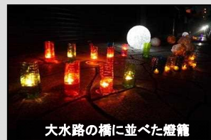
大水路の橋に並べた燈籠