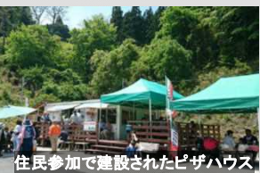
住民参加で建設されたピザハウス