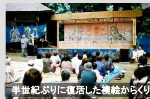
半世紀ぶりに復活した襖絵からくり