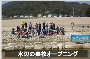
水辺の楽校オープニング