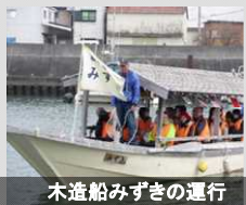
木造船みずぎの運行