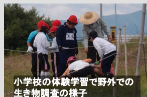
小学校の体験学習で野外での生き物調査の様子