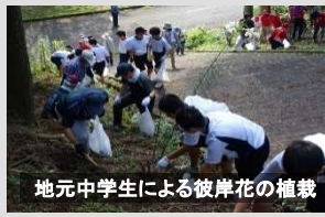
地元中学生による彼岸花の植栽