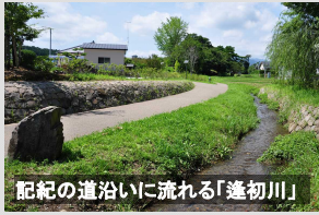
記紀の道沿いに流れる「逢初川」