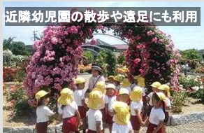
近隣幼児園の散歩や遠足にも利用