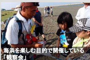
海浜を楽しむ目的で開催している「観察会」