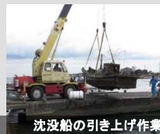
沈没船の引き上げ作業