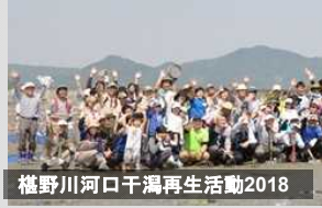
檜野川河口干潟再生活動2018