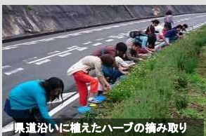
県道沿いに植えたハーブの摘み取り