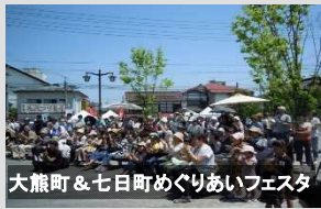
大熊町 & 七日町めぐりあいフェスタ

No. 1 (福島県・会津若松市) 通りの地域資源を活かした『大正浪漫調』のまちづくり