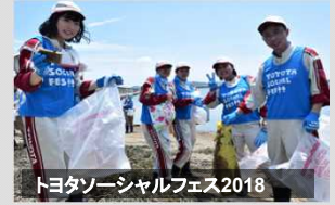
トヨタソーシャルフェス2018