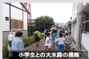
小学生と大水路の掃除