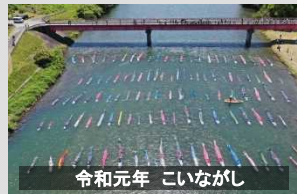
令和元年 こいながし