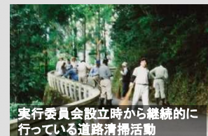
実行委員会設立時から継続的に行っている道路清掃活動