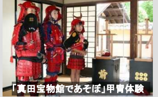
「真田宝物館であそぼ」甲冑体験