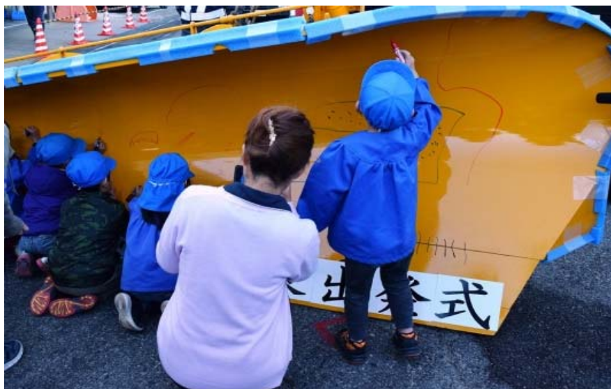
園児によるお絵描き