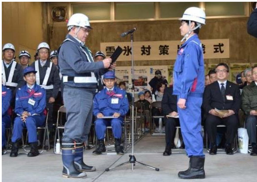
受注者による安全宣言