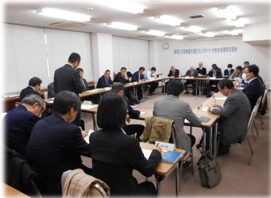
「大型車通行適正化に向けた中部地域連絡協議会」の状況

全国の整備局初の取組として、道路の老朽化対策が喫緊の画題であり、道路の劣化に与える影響が大きい重量を違法に超過した大型車への対策が急務であったことから、大型車両の適正かつ安全な走行に向けて、道路管理者、公安委員会、関係行政機関、関係企業団体等がパートナーとなって連携し、情報の共有や意見交換等を行うことを目的に、「大型車通行適正化に向けた中部地域連絡協議会」を平成27年1月27日に設立しました。