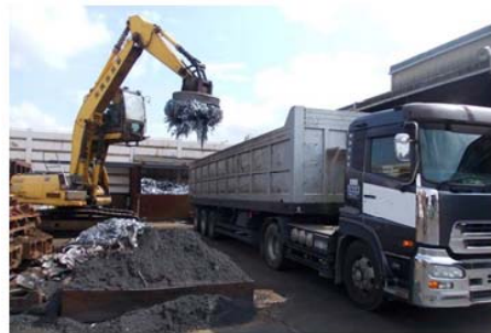
積載物の軽減作業

別添資料の「取材申込書」にご記入のうえ、10月 31日（木）正午までにご連絡下さい。 ※ 連絡先へ当日のアクセスや撮影場所等の説明をいたします。（尚、豊郷車両計測所へは取材不可）