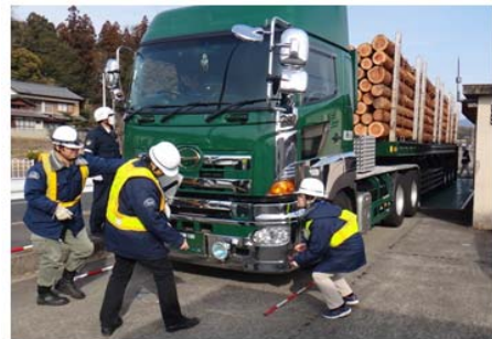
車両寸法の計測状況