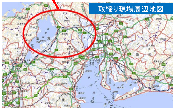
取締り現場周辺地図