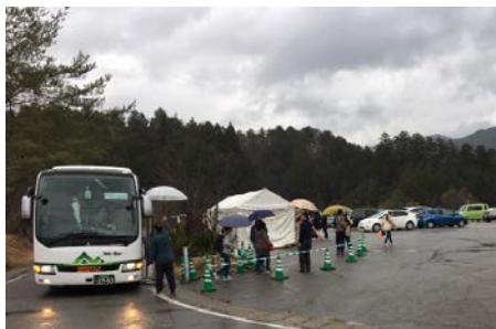
○匠ヶ丘駐車場の様子