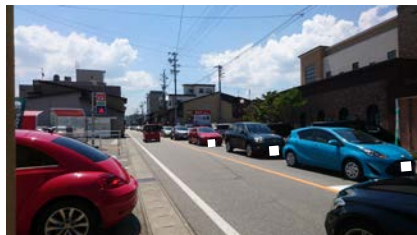
○国分寺東交差点付近の様子