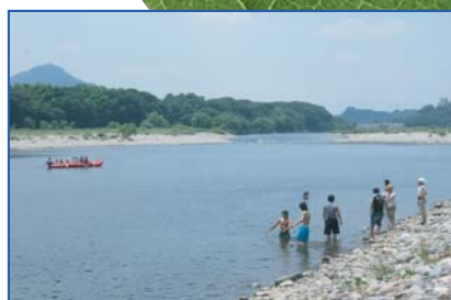
いつまでもきれいな水辺