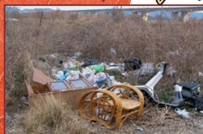
ますますゴミが増える