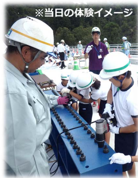
※当日の体験イメージ