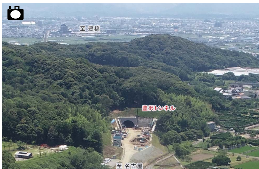
名古屋方面より豊橋方面を望む (R1.6月撮影)