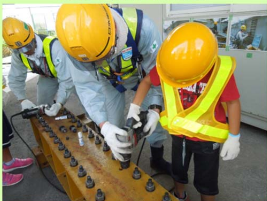
ボルト締め付け体験