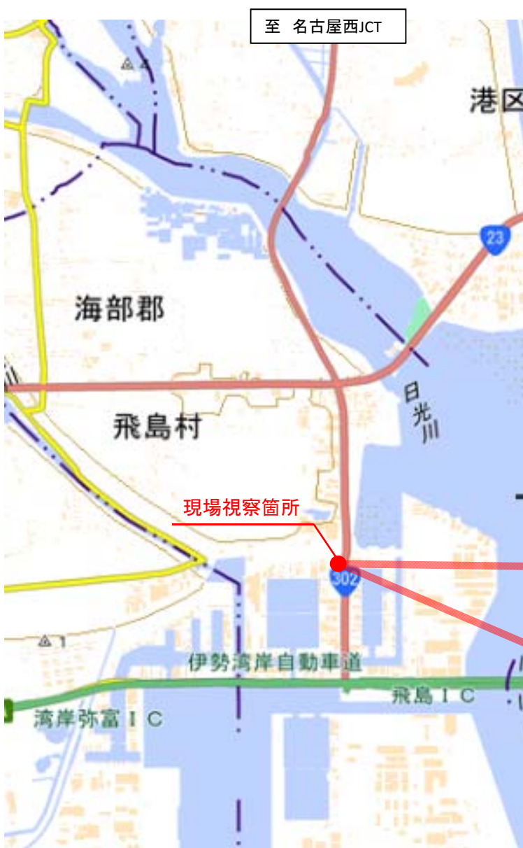
橋梁工事の進捗状況(木場交差点付近)