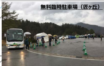
無料臨時駐車場(匠ヶ丘)

1日11時より 臨時駐車場を ご利用の方先着 100名に500円分 商品券 プレゼント!