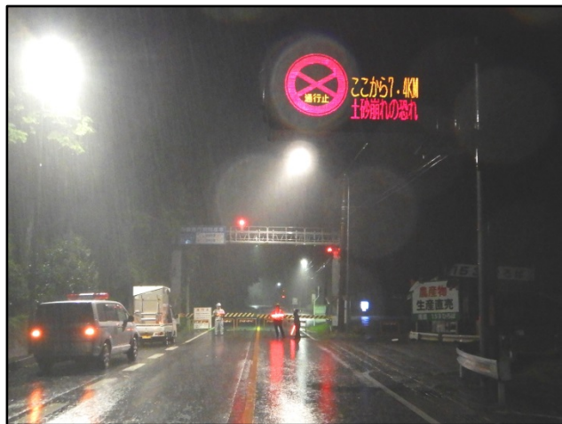
小田木遮断機を使用した夜間通行止の様子(H30.9.5)