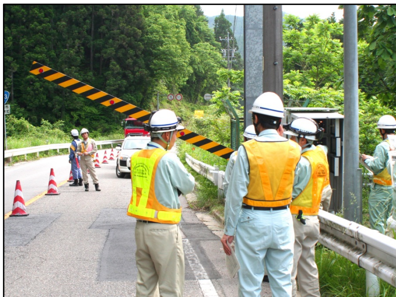
実際に操作し、人力で遮断機をおろす