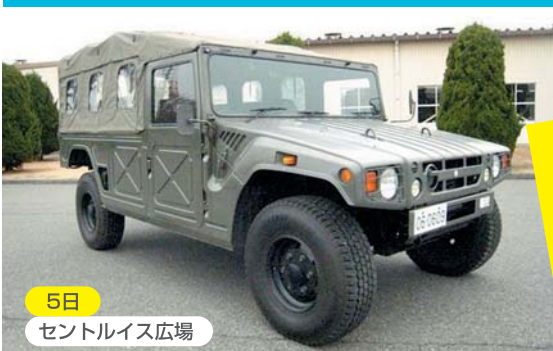
5日 セントルイス広場

主催：国営木曾三川公園 三派川地区センターイベント実行委員会 後援：木曾川上流域公園整備促進期成同盟会