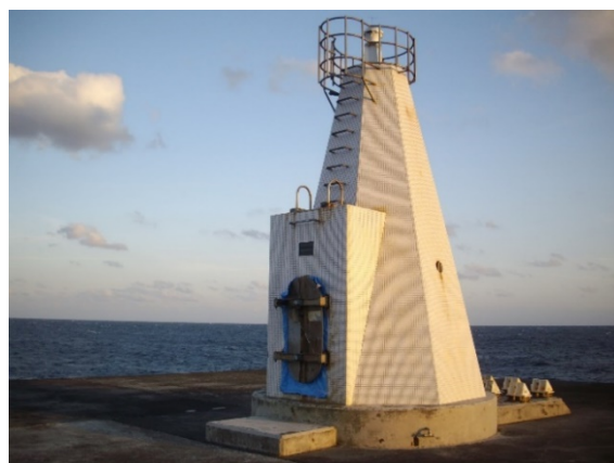
<伊豆大島に設置されている同タイプの灯台>