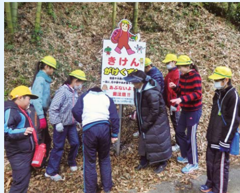
岡崎市立常磐東小学校