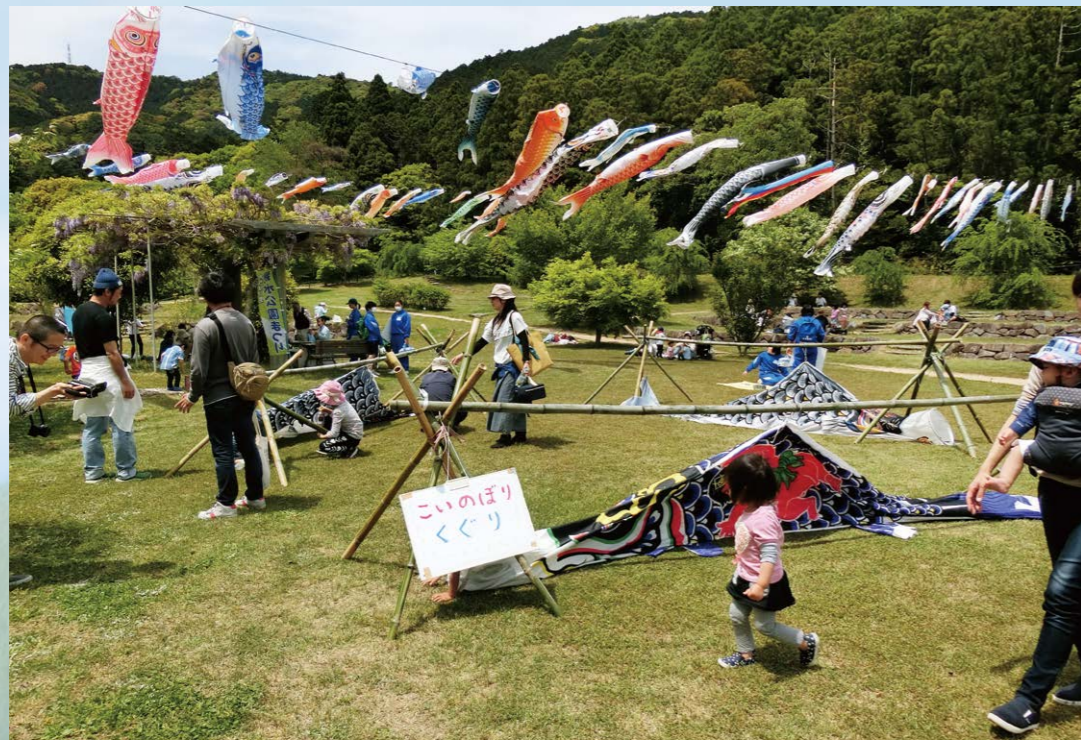
春の親水公園祭り