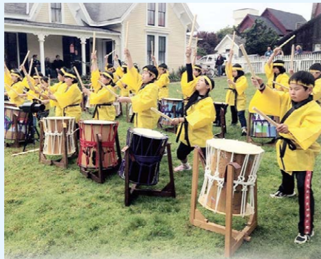
美麻地域づくり会議