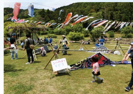
湖西フロンティア倶楽部(静岡県湖西市)