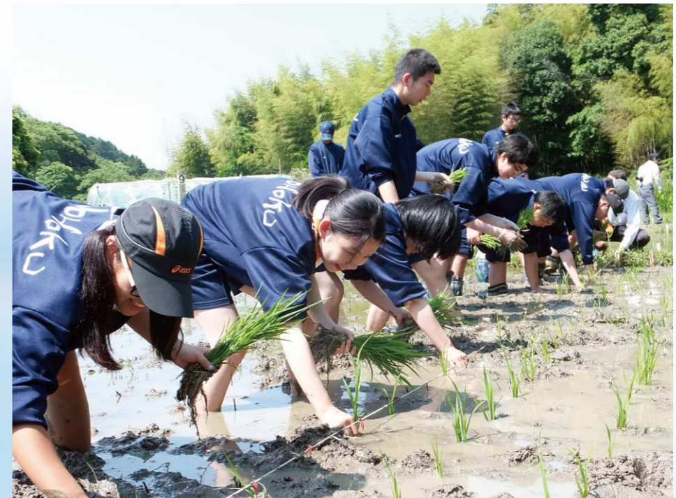
地域の自然を守る「環境ボランティア活動」(里山づくり)