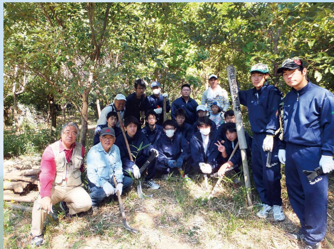
地域の自然を守る「環境ボランティア活動」(潜在自然植生による森づくり)

本校では、環境部員を中心に全国の工業高校に先駆け国際規格「環境マネジメントシステム(ISO14001)」・内部監査員研修(合格852名)にも挑戦、また、年間を通して取り組む生徒たちの環境ボランティア活動を、英語・数学等と全く同様の卒業認定単位(認定462名:「工業技術基礎」の増加単位)として認定する県下で唯一の工業高校となっています。