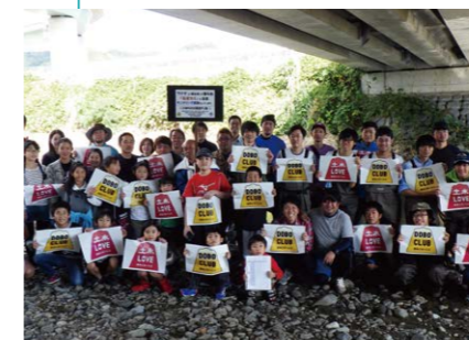
いはらの川再生PJ会(静岡県静岡市)