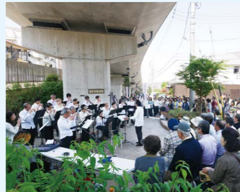
和みの散歩道の会