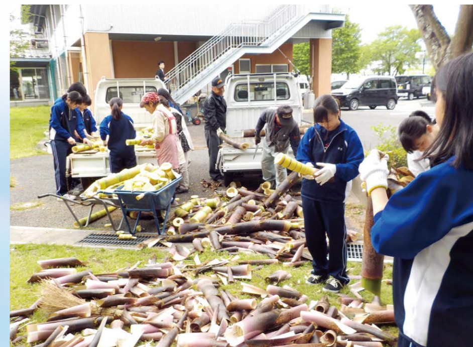
高校生とメンマづくり