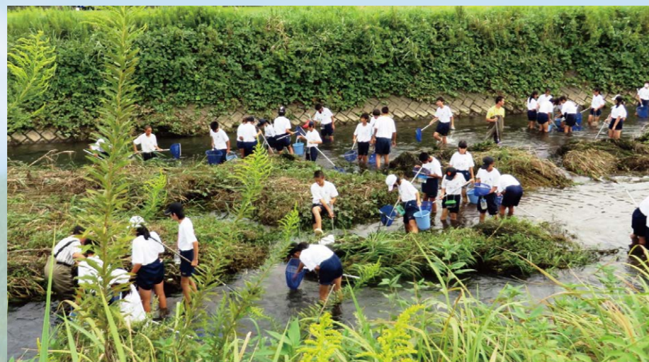
長森南中学校の生き物調査