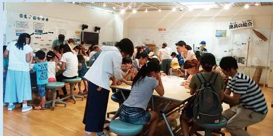
水辺共生体験館夏休み科学工作教室UVビーズ

自分にできることにつなぐ学習活動としては、学校の総合学習の時間を利用した水や川を学ぶ学習活動があります。特に、川が多く水の学習をする機会が多い岐阜県では、水や川を知り、生き物や川の上流の様子、身近な川の防災まで体系的に学ぶことが必要と考えており、岐阜県や自治体環境課等とも協力して「川の生き物調査」等の体験を含めた学習活動を毎年6~10校で実施しています。