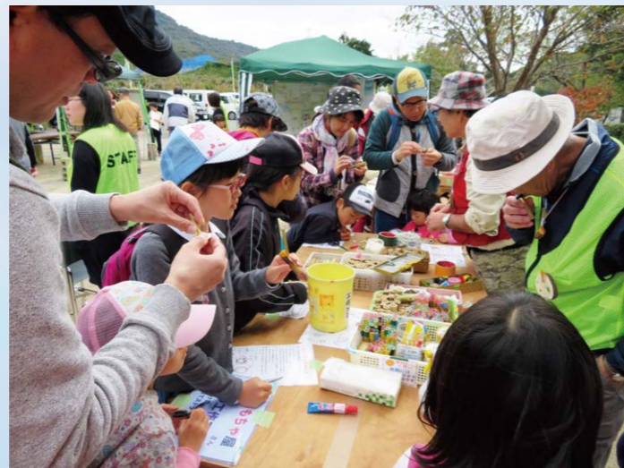
無料クラフト体験(竹笛・木製ペンダント)

2月の親水公園梅まつりでは、隣接する梅林で花見を楽しみ、6月には梅の収穫体験も実施しています。