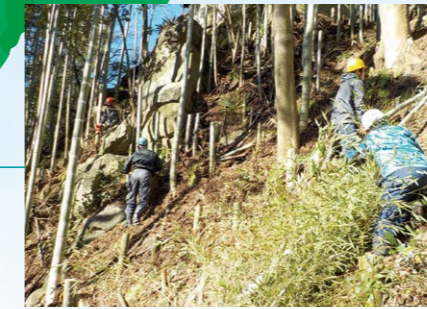
天竜川鷺流峡復活プロジェクト (長野県飯田市)