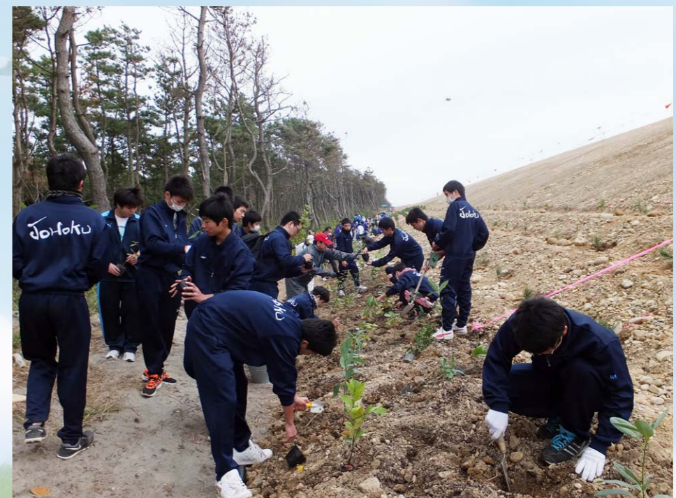
地域の自然を守る「環境ボランティア活動」(防潮堤の植樹)