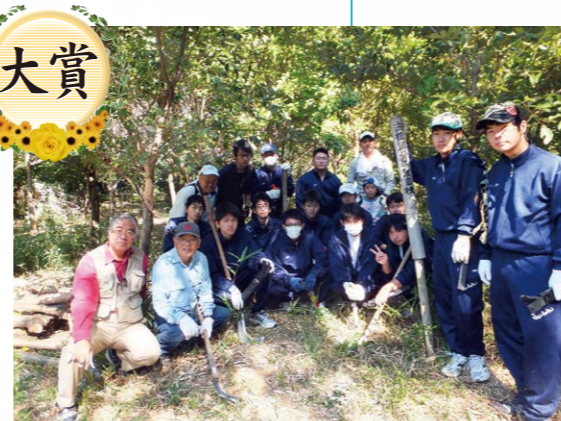
静岡県立浜松城北工業高等学校・環境部 (静岡県浜松市)