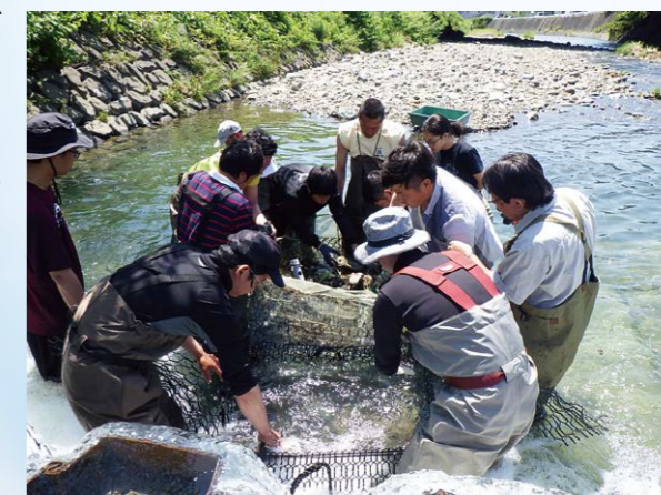
モニタリングの様子

ニホンウナギの保護再生活動によって庵原の優れた河川環境を次世代に残し、庵原で生まれた子供や若者をはじめとする庵原人が庵原川を誇りに思い、地域の宝物となるような取組にしたいと日々頑張っています。