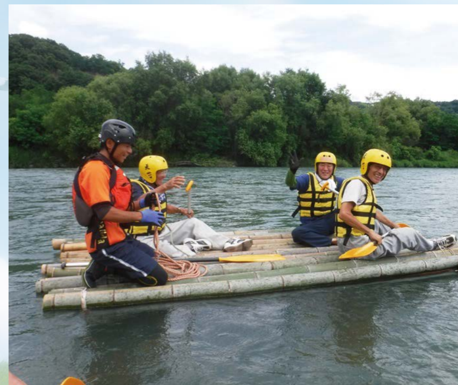
楽しくいかだ下り