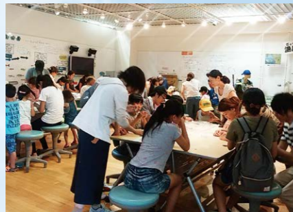
特定非営利活動法人 e-plus生涯学習研究所 (岐阜県岐阜市)