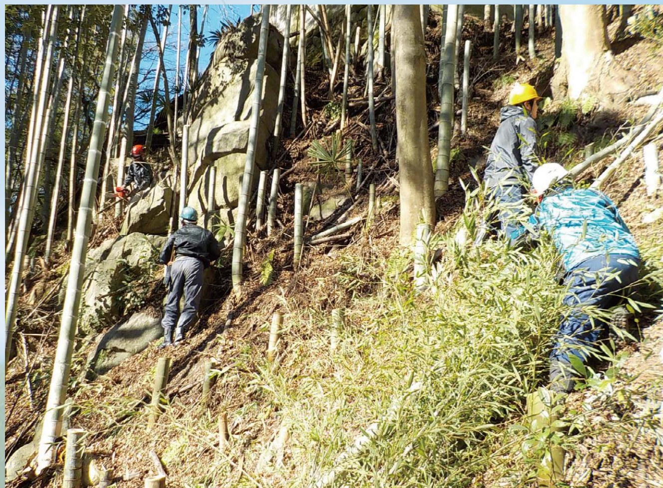
過酷な斜面で竹林整備

また、地元の小学校、高等学校等とも連携し、様々な体験学習、環境教育の場としても活用されており、次世代を担う人材の育成にも貢献しています。