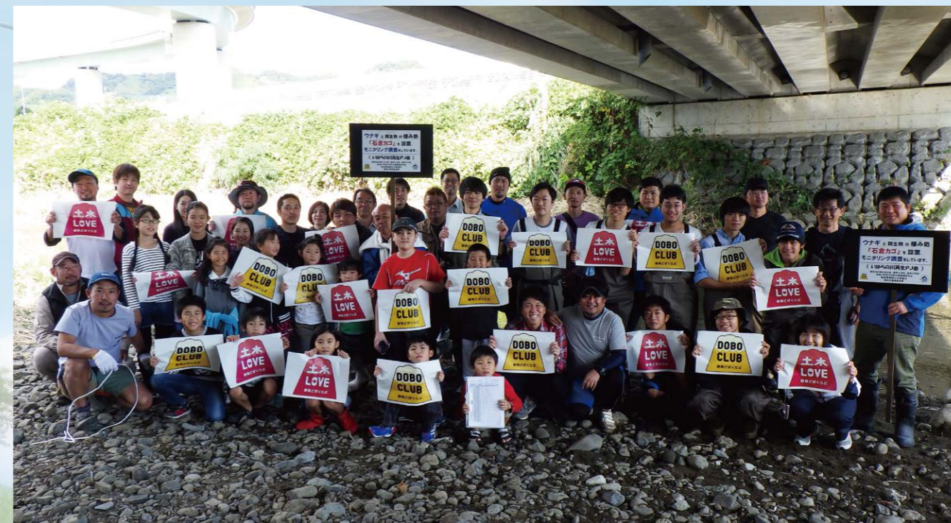
庵原川でつながる仲間たち