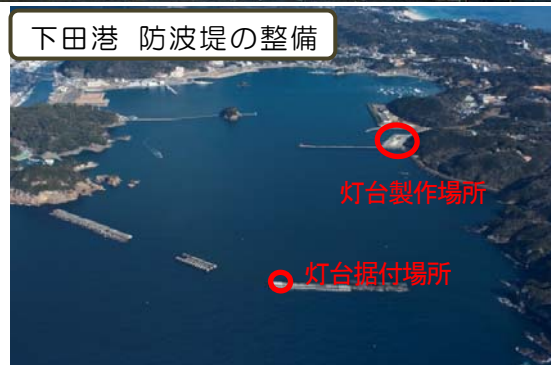
下田港 防波堤の整備