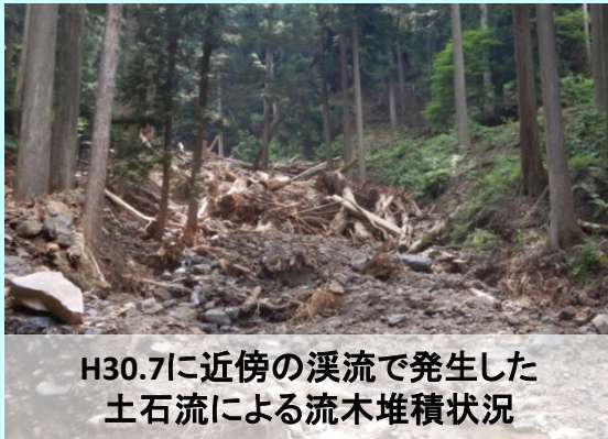
H30.7に近傍の溪流で発生した土石流による流木堆積状況