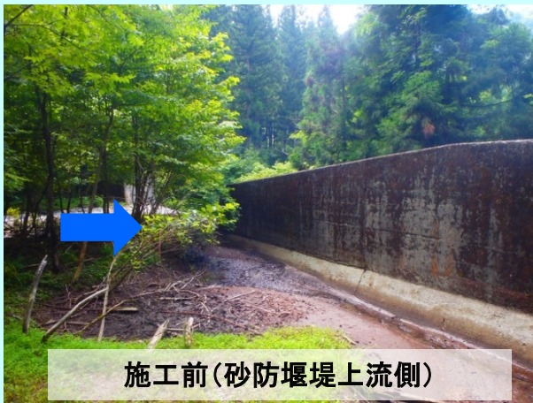
施工前(砂防堰堤上流側)