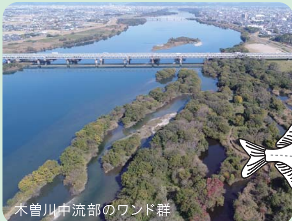
木曽川中流部のワンド群

イタセンパラ(コイ科タナゴ亜科)は、二枚貝に産卵する日本固有のタナゴ類の1種です。分布は濃尾平野を含む国内3地域に限られ、いずれの地域においても絶滅が危惧されており、国の天然記念物に指定されています。